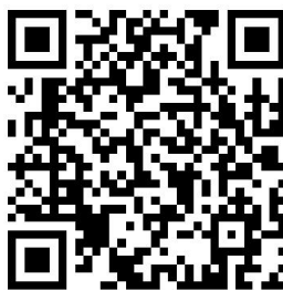
30.抚顺市社会保险养老保险缴费申报（机关事业）