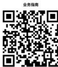
27.抚顺市社会保险职工参保登记（机关事业）