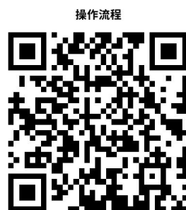
40.社会保障卡应用状态查询