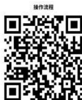
10.抚顺市城乡居民养老保险参保登记流程

②网上办：辽宁省人力资源和社会保障公共服务平台： http://218.60.150.1:8081/ehrss/login/